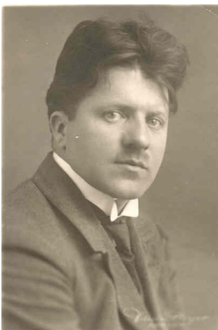
nicht datiert, ca. 1910